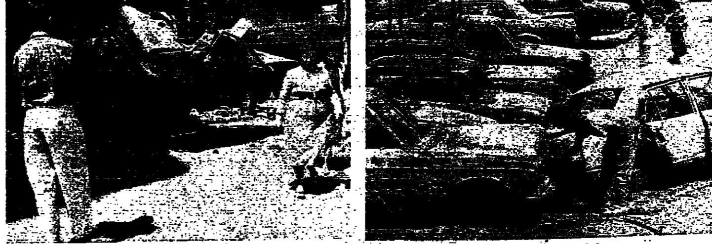
معرض سيارات في عين الرمانة.